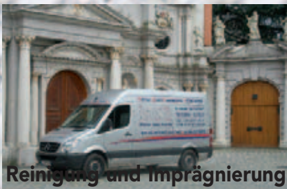
Reinigung und Imprägnierung