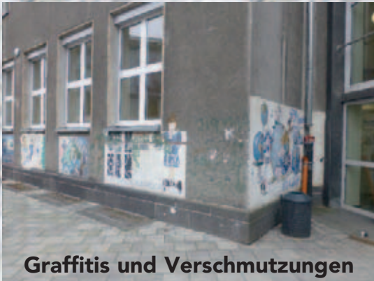
Graffitis und Verschmutzungen